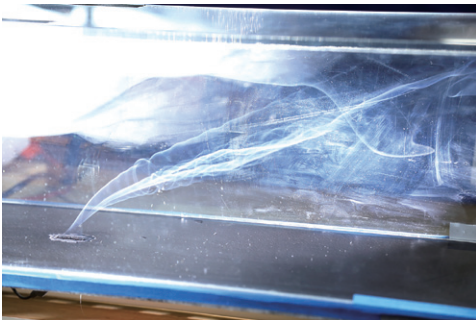
写真5 火災旋風の可視化実験

日常生活で使用される身近なものの中には、扱い方を間違えると急激な燃焼現象を生じるものがあります。そのような危険性のあるでんぷん粉末を用いた粉じん爆発実験（写真）、スプレー噴射剤を用いた大きな爆発音を発生する燃焼実験を行いました。