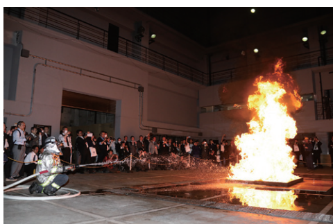
写真2 可燃性液体火災の泡消火実験

消防隊員が現場に近づけない特殊な災害において、ロボットが自ら判断し、複数のロボットが互いに連携しながら情報収集や放水などの活動をする消防ロボットシステムの紹介を行いました。