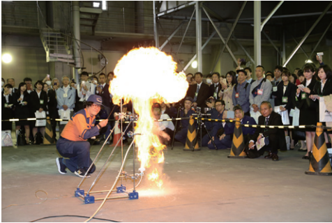
写真4 粉じん爆発実験

日常生活で使用される身近なものの中には、扱い方を間違えると急激な燃焼現象を生じるものがあります。そのような危険性のあるでんぷん粉末を用いた粉じん爆発実験（写真）、スプレー噴射剤を用いた大きな爆発音を発生する燃焼実験を行いました。