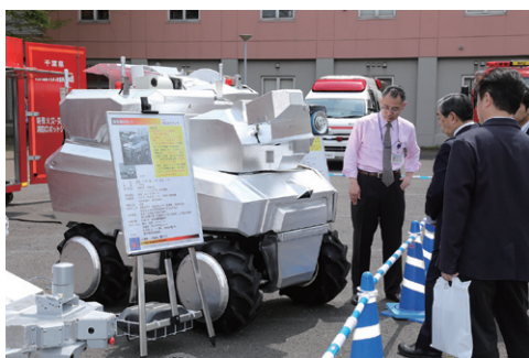
写真1 消防ロボットシステムの展示

本年度も、27項目にわたる展示、そのうち8項目については燃焼実験などの実演を行い、一般の方に加え、消防職員や防災関係企業など、580人を超える来訪者を迎えることができました。以下で、主な展示・実演の様子を紹介します。