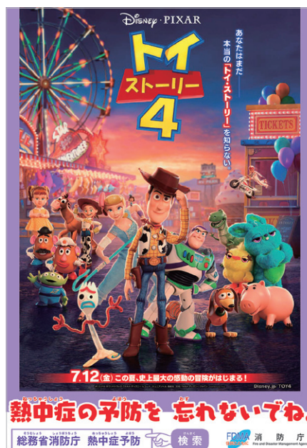
熱中症予防啓発ポスター

https://www.disney.co.jp/movie/toy4.html