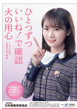
全国統一防火標語ポスター

平成30年中の住宅火災による死者数は1,028人であり、全ての火災による死者数1,427人の約7割を占めています。火災による被害を減らすためには、一人ひとりが普段の生活の中で、防火に対する意識を高め、火災予防の対策を行うことが重要です。「住宅防火いのちを守る7つのポイント」を参考に身の回りの火災予防について確認しましょう。