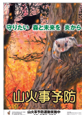
全国山火事予防運動ポスター