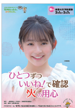
春季全国火災予防運動ポスター

消防庁では、「ひとつずつ いいね！で確認 火の用心」を2019年度全国統一防火標語とし、令和2年3月1日から7日までの7日間にわたり、「春季全国火災予防運動」を実施します。