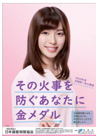
全国統一防火標語ポスター

令和元年中の住宅火災による死者数は1,000人であり、全ての火災による死者数1,486人の約7割を占めています。火災による被害を減らすためには、一人ひとりが普段の生活の中で、防火に対する意識を高め、火災予防の対策を行うことが重要です。「住宅防火いのちを守る7つのポイント」を参考に身の回りの火災予防について確認しましょう。