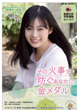
春季全国火災予防運動ポスター

消防庁では、「その火事を 防ぐあなたに 金メダル」を2020年度全国統一防火標語とし、令和3年3月1日から7日までの7日間にわたり、「春季全国火災予防運動」を実施します。