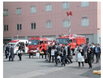
消防車両等の展示 [消防大学校]

消防研究センター、消防大学校、日本消防検定協会及び一般財団法人消防防災科学センターでは、令和3年度の科学技術週間にあたり、一般の方々に試験研究施設の公開や消防用機械器具、消防防災科学技術の研究開発の展示、実演等を下記の通り行う予定です。