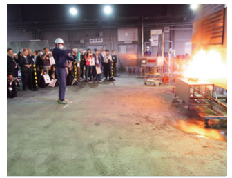
住宅用消火器による天ぷら油火災の消火実演