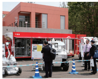
災害対応のための消防ロボットシステム [消防研究センター]