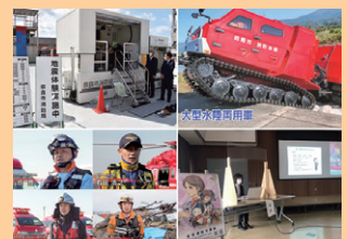
■ 表紙 本号掲載記事より