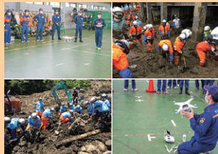
■ 表紙 本号掲載記事より