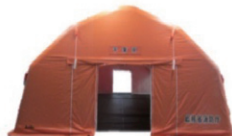
【高機能エアートント】