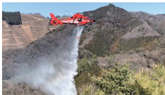
栃木県足利市林野火災活動状況