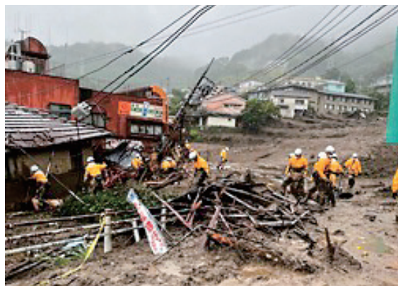
静岡県熱海市土石流災害活動状況