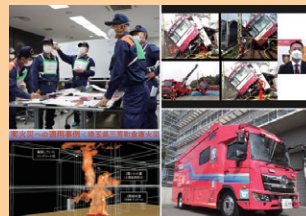
■ 表紙 本号掲載記事より