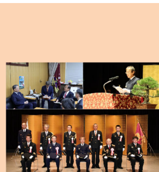
■表紙 本号掲載記事より

令和5年度市町村長の災害対応力強化のための研修の開催……………22 風水害に対する備え……………23