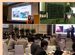
■表紙 本号掲載記事より