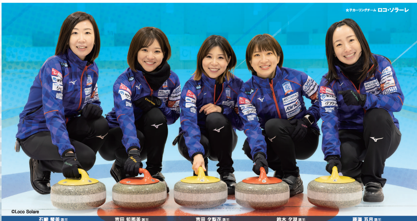
女子カーリングチーム ロコ・ソラーレ