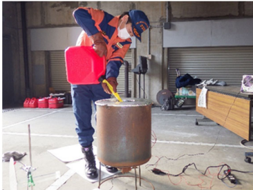
図 4 輸送検討会におけるガソリンの電荷量の計測状況

なお、UN表示については、危険物輸送に使用する場合は容器の製造日から 5 年以内としなければならないとされているため、専ら乗用の用に供する車両による運搬で使用する場合は留意する必要があります。また、容器記号の「3H1」は、ジェリカン（方形又は多角形の断面形状を有する容器）であって、その材質がプラスチックであり、天板が固着式のものであることを示します。