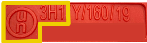
図 5 UN表示等の例

エ 運搬容器の内圧試験に関する事項について (⑦) 輸送検討会を進める中で、危告示第 68 条の 5 第 4 項第 1 号に規定する内圧試験について、海上輸送に係る船舶安全法では、消防法に定める試験方法以外の方法を定めていることが判明しました。