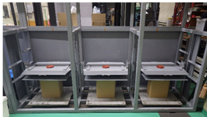
図2 輸送検討会における積み重ね試験の実施状況

イ 繊維強化プラスチック製変圧器に係る機械により荷役する構造を有する運搬容器に係る事項（⑤）（図3）