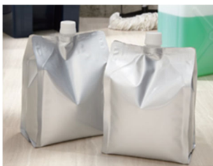
図1 プラスチックフィルム袋の例

なお、「不活性の緩衝材」とは、収納する危険物と反応を起こさず、組合せ容器とした際に緩衝機能を有しているものをいいます。