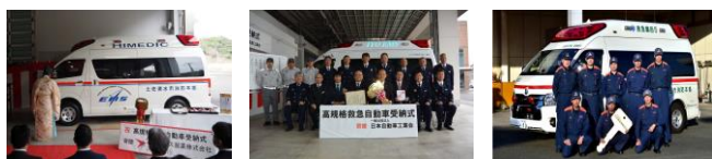
アステラス製薬株式会社 寄贈 土佐清水市消防本部（高知県） 一般社団法人 日本自動車工業会 寄贈 伊予消防等事務組合（愛媛県） 一般社団法人 日本損害保険協会 寄贈 磐田市消防本部（静岡県）

寄贈を受けた消防本部からは「円滑な救急業務の遂行にあたり、高規格救急自動車の寄贈は大変ありがたい」など、寄贈元団体への感謝の言葉が寄せられており、本事業は、救急業務の高度化、救急業務体制の充実に大きく寄与しているものと考えています。