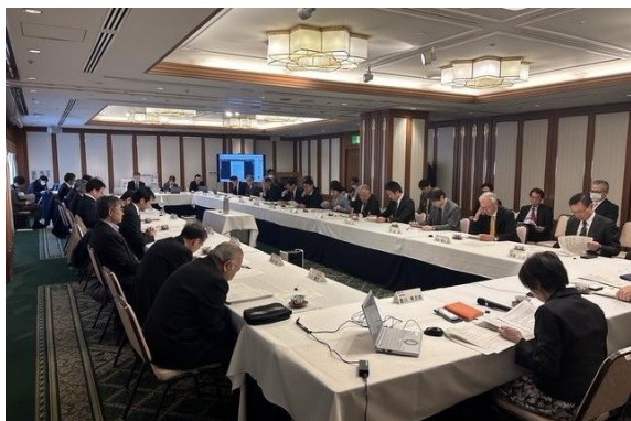
第2回住宅防火対策推進懇談会（令和7年2月20日）

https://www.fdma.go.jp/singi_kento/kento/post-166.html