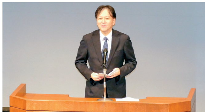
大沢消防庁長官挨拶

昭和44年に誕生した女性消防吏員は、現在では全国で6,000人を超えるまでに増加し、適材適所の考え方のもとで、その職域も着実に拡大しています。消防庁としても引き続き、女性活躍推進に向けた様々な取組を行ってまいります。