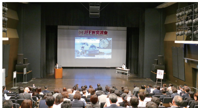
交流会の様子（講演）