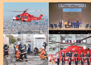
■ 表紙 本号掲載記事より

風水害に対する備え ..... 21 e-カレッジによる防災・危機管理教育のお知らせ ..... 22 国民保護のための避難行動の周知促進 ..... 23