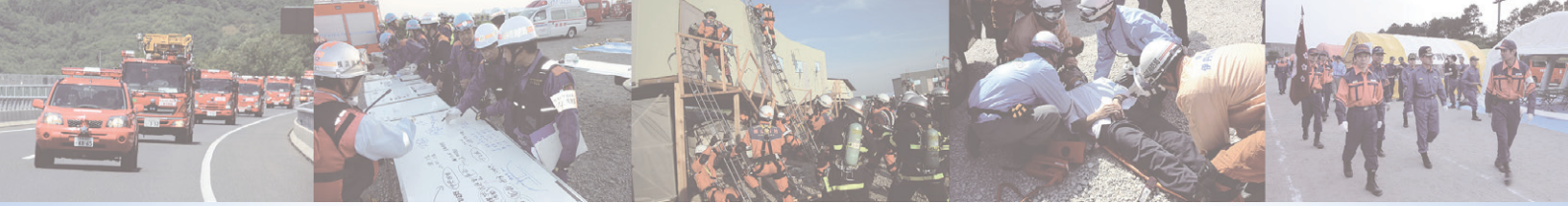
図1 緊急消防援助隊登録部隊の推移 (令和8年4月1日)