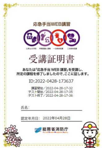
(旧コンテンツ受講証明書)

※令和5年3月まで公開していた旧コンテンツから発行された受講証明書と同等の証明書です。