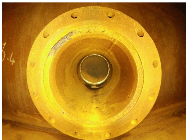
タンク底面のノズル