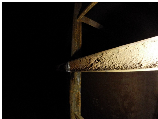
腐食のテストピース