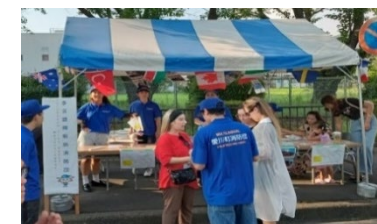
【防災アンケート時の写真】