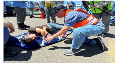
【多数傷病者対応訓練中の写真】

外国人団員が応急手当や防災に関する知識を習得することで、 市内に暮らす外国人が安心・安全に生活できるとともに、災害時における体制を整え、消防職員・団員が一丸となった防災対策を展開している。