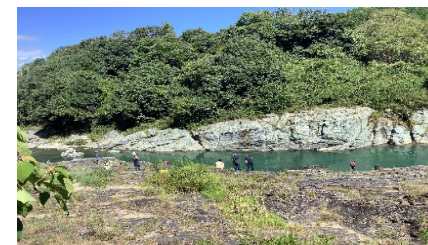
【水難救助活動中の写真②】