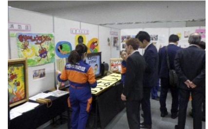
【イベント内ブースの様子】