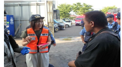
【現場対応中の写真】