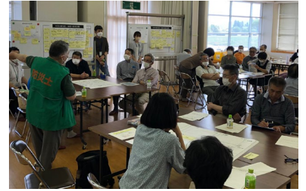
【(富山県)地区防災計画策定研修の様子】