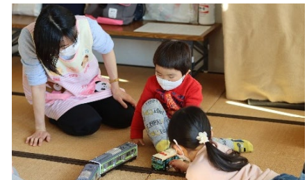
【保育ボランティアによる託児】