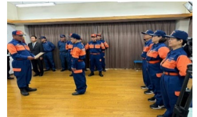
【辞令交付式の写真】

日頃から防災の知識等を周知することで、 外国人住民の災害への対応力や防災意識の向上に寄与している。