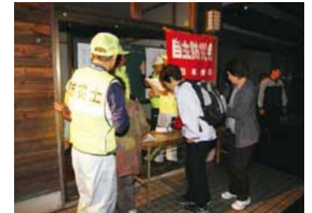
【防災士が参加した夜間訓練の様子】