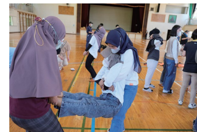
【外国人技能実習生と中学生による避難所開設訓練の様子】