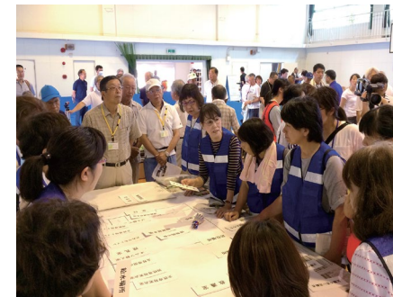
【避難所レイアウト訓練の様子】