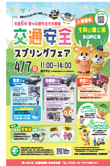
【令和6年度参加イベントチラシ】

消防単独でイベントを実施するよりも多くの方が来場し、消防団の効果的・効率的な広報活動につながった。