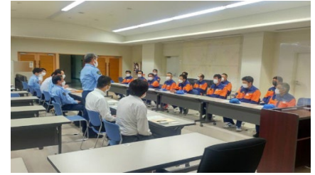
【意見交換会の写真】