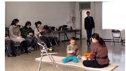
【団員による見守り】