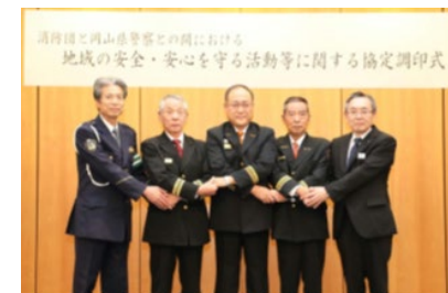
【協定締結時の写真】

各消防団と警察署の相互理解が深まり、より緊密な連携を図りながら地域の安全・安心に向けた各種活動が行えるようになった。