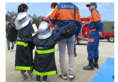
【イベント開催時の写真】