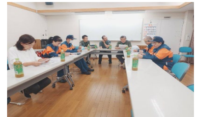
【市総合防災訓練の打ち合わせの写真】