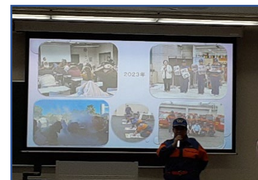
【大学で講演活動中の写真】