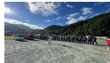
【水難救助活動中の写真①】