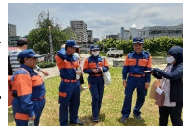
【マルシェでの防災啓発活動中の写真】