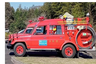
【パトロールステッカーを貼付した消防団車両】