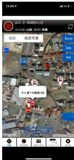
【火災発生時】 出勤車両や水利、発生場所との距離間 (半径「50m」「100m」「150m」間隔)