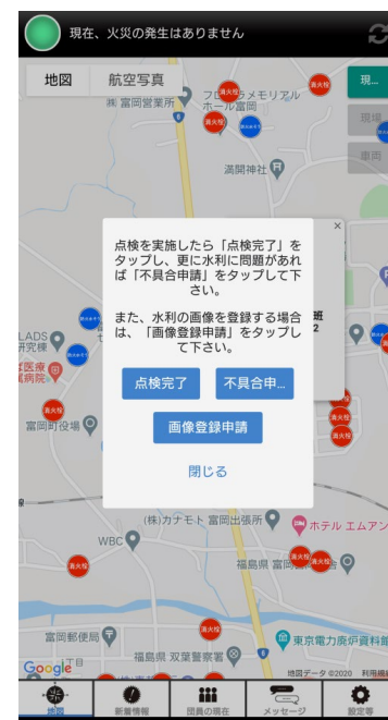
不具合の申請なども可能 地図は2種類随時切替可能