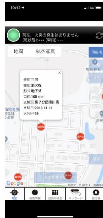
【平常時: 水利点検】 点検日等を入力