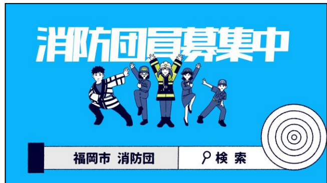
消防団員募集のホームページへ誘導