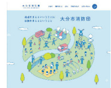
メインビジュアル