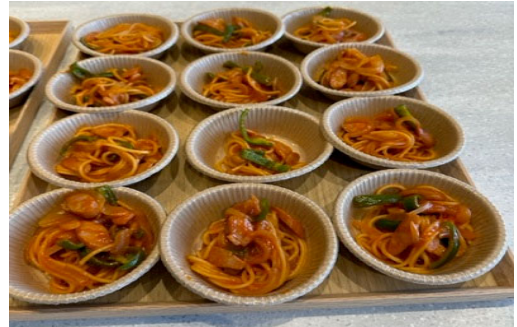
・調理した防災食