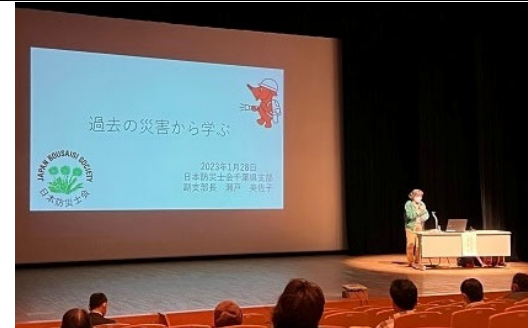
・防災講座の様子