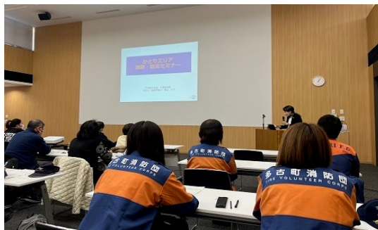
・防災講座の様子