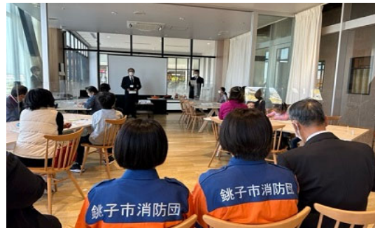
・防災講座の様子