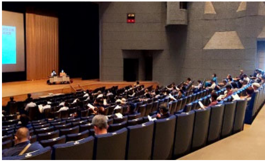
・防災講座の様子