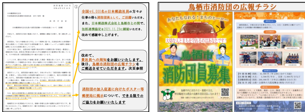
郵便局長会での説明資料

令和 4 年 11 月に開催された郵便局長会（オンラインで実施）の冒頭に、お時間をいただき、郵便局職員の消防団入団についての周知依頼、消防庁から配布される消防団員の募集ポスターの掲示依頼について事前説明を行った。