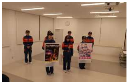
学生消防隊によるケーブルテレビ出演