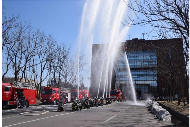
烈風下等火災消防訓練