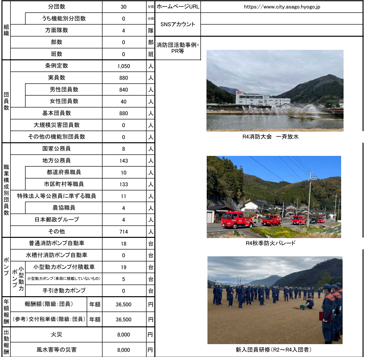
R4消防大会 一斉放水