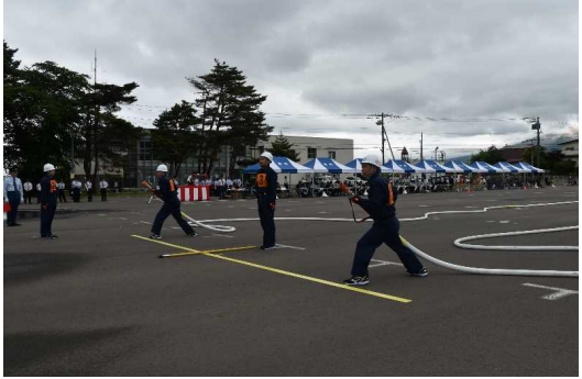
森町消防訓練大会