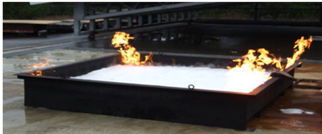
【水溶性液体用泡消火薬剤の試験】

4㎡の正方形で高さが0.3mの火皿に貯蔵し、又は取り扱う水溶性液体危険物を表面までの高さが0.1mになるように入れた状態で点火し、1分経過した後に、泡水溶液を5分間連続で放射し、泡の規格省令第13条の消火性能試験の基準を満たすか確認する。