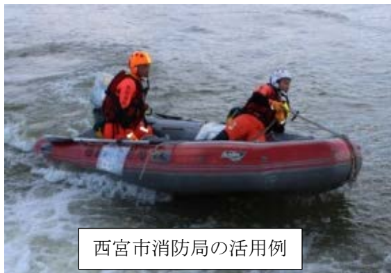
西宮市消防局の活用例