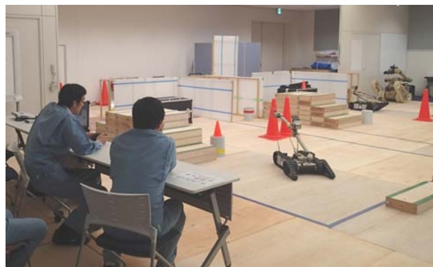
原子力緊急事態支援センターでの操作訓練の様子