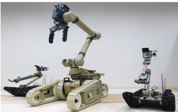
中央: Warrior 左右: PackBot® (iRobot®社製)

PackBot®の運転・操作(走行, 階段昇降, 物品挿取) 実施回数 31回 参加人数 約210名(12社計)