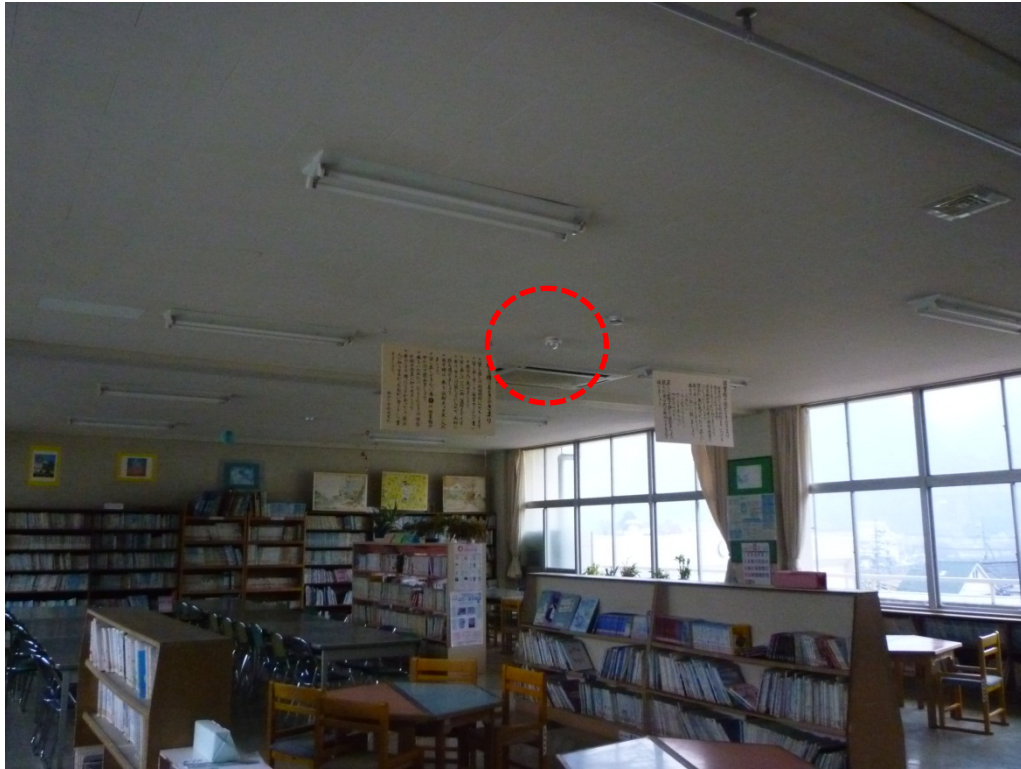
学校の教室(図書室)