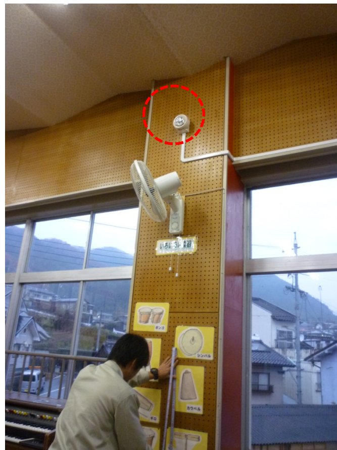
特殊な天井の場合