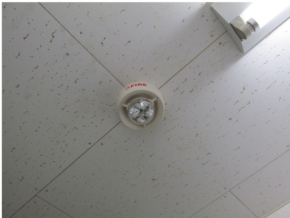
天井面への設置状況