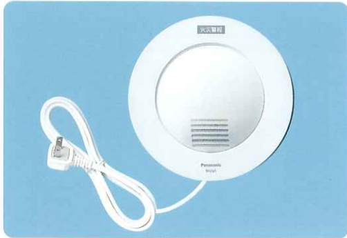
パナソニック電工(株) 製 SH260 鑑定型式番号 鑑住補第21~5号