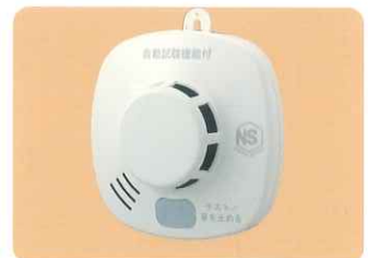
ホーチキ(株) 製 SS-2LQH-10HCB 煙式(電池式) ●無電圧接点出力 DC30V 0.5A