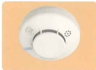
能美防災(株) 製 FSKJ217-S 煙式(電池式) ●無電圧接点出力 DC50V 0.1A