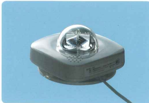
サクサプレシジョン(株) 製 SHW-101 鑑定型式番号 鑑住補第19~4号