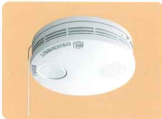
パナソニック電工(株) 製 SH38453 煙式(電池式) ●無電圧接点出力 DC30V 0.5A