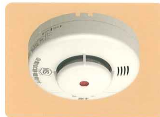
ニッタン(株) 製 KRH-1S 煙式(電池式) ●無電圧接点出力 DC30V 0.2A