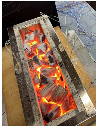
⑥最高温度付近での燃烧状態（黒炭）