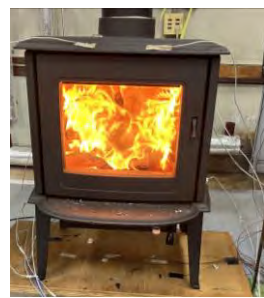
④燃料投入直後 (カラマツ)

使用機器 (1) 薪ストーブ1 (鋳物製のもの) ・メーカー：モルソー社 ・型式：7110CB ・サイズ：高さ740mm×幅575mm×564mm