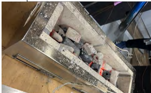
⑤燃料投入直前（オガ炭（白））