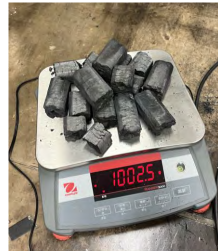
③本使用機器での標準投入量 （オガ炭（白）約1kg）