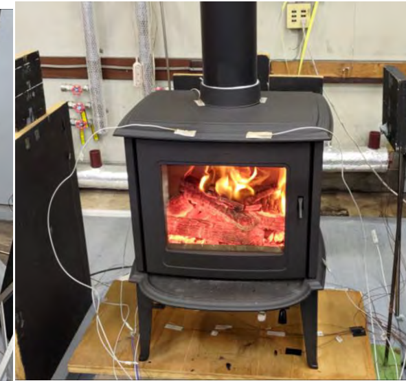
⑦最高温度付近での燃焼状態 (カラマツ)