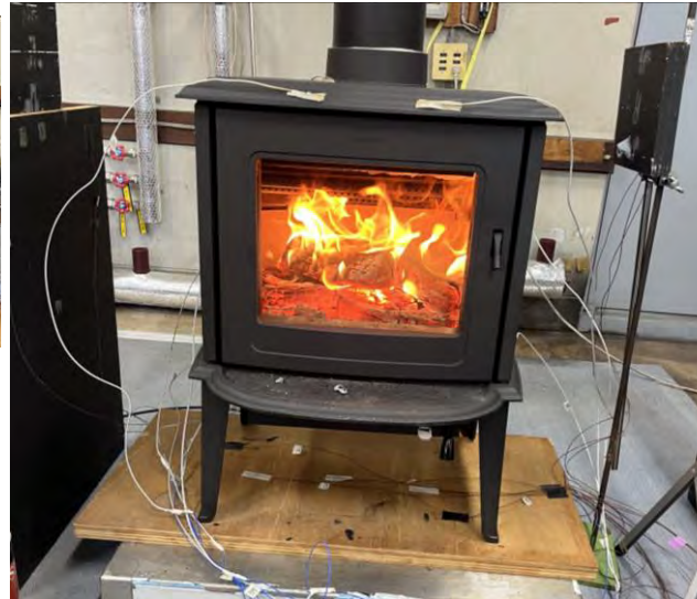
⑥最高温度付近での燃焼状態 (ナラ)