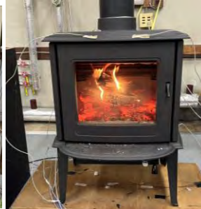
⑤燃料投入直前 (カラマツ)