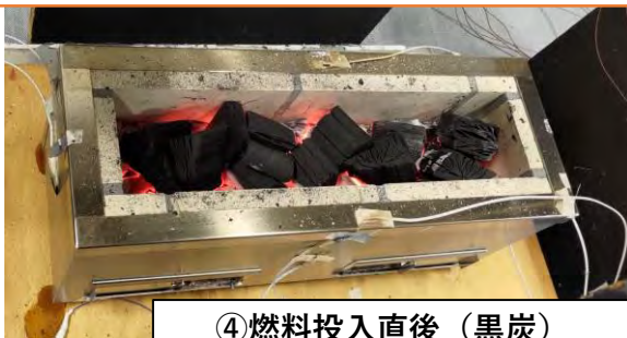
④燃料投入直後（黒炭）