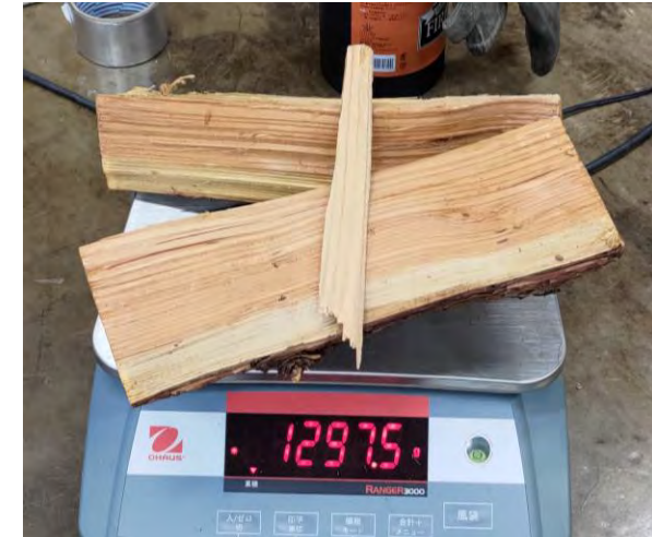
③本使用機器での標準投入量 (カラマツ約1.3kg)

使用機器 (1) 薪ストーブ1 (鋳物製のもの) ・メーカー：モルソー社 ・型式：7110CB ・サイズ：高さ740mm×幅575mm×564mm