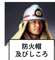
防火帽 及びしころ