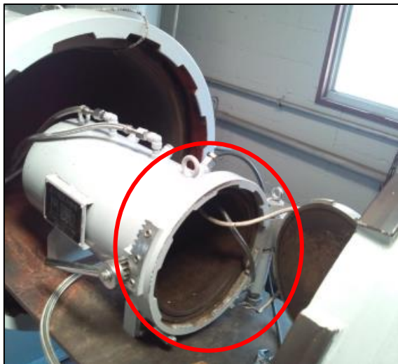
防爆チャンバー：おおよそ横 60cm×高さ 30cm の円筒形