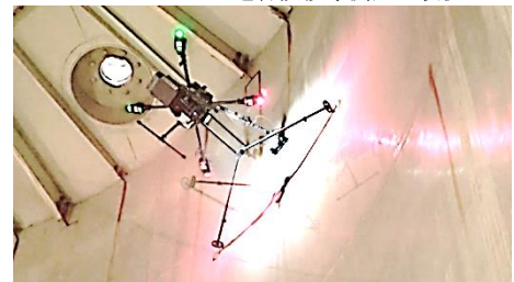
ドローンによる超音波板厚測定の様相