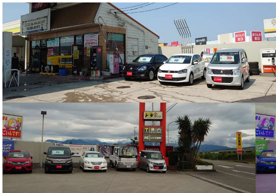
写真上：西条中央SS 下：河原津SS