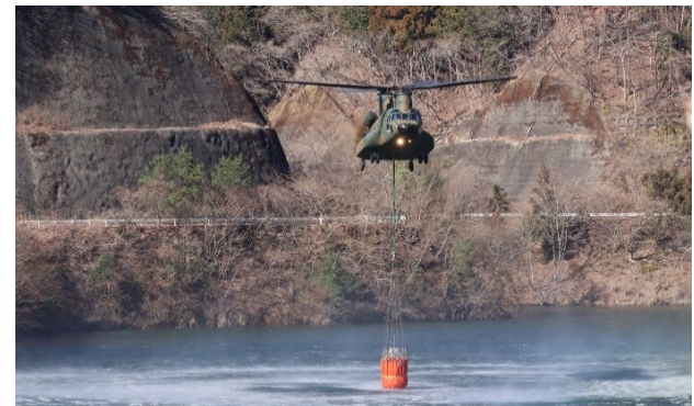
CH-47によるダムからの取水