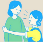
認知症ケア技法の普及/ アジア諸国の介護 リーダーの育成