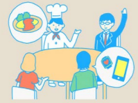
「福岡ヘルス・ラボ」 による オープンイノベーション