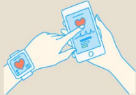
ICTやIoTを活用した 健康づくり・見守りの 仕組みづくり