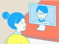
ICTを活用した 遠隔診療