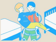
ケア領域の 新たな技術