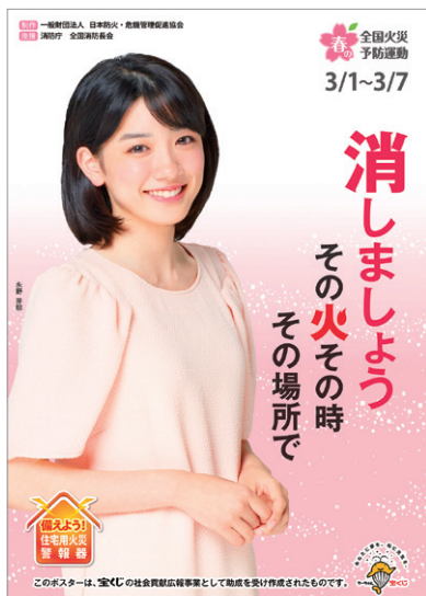
平成29年春季全国火災予防運動広報ポスター